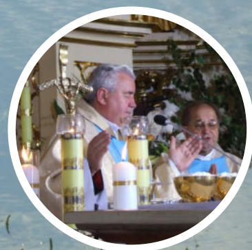
SPOTKANIE RODZINY RADIA MARYJA