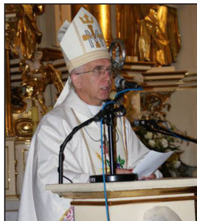
Pasterz Diecezji przewodniczy modlitwemu spotkaniu