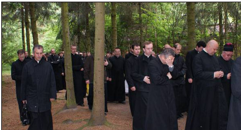
Kapłani na Drodze Krzyżowej