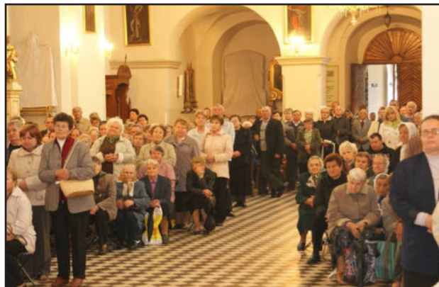
Chorzy zgromadzeni u Stóp Matki Bożej Krasnobrodzkiej

Po Mszy Świętej, wszyscy trwali na modlitwie modląc się słowami Litanii do Imienia Jezus, a Ksiądz Biskup przecho-