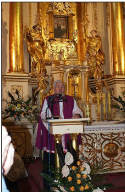
Ks. Prałat wita przybyłych pielgrzymów

Miesiąc maj, to czas w którym do Matki Bożej Krasnobrodzkiej przybywa wielu pielgrzymów – przede