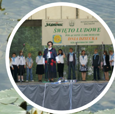
ŚWIĘTO LUDOWE I DZIEŃ DZIECKA