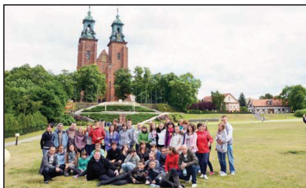
Wspólne zdjęcie przed Katedrą Gnieźnieńską