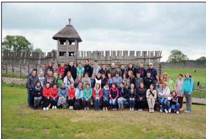
Przed Muzeum Archeologicznym w Biskupinie

z Łagiewnik przywiozły też trumnę ze szczątkami świętej, 40 relikwiarzy z całej Polski oraz konfesjonał, przy którym spowiadała się siostra Faustyna. W tegorocznym programie pielgrzymki znalazło się „spotkanie” z siostrą Faustyną, z wizerunkiem Chrystusa Miłosiernego, a także z drugim człowiekiem.