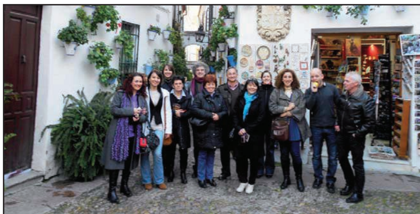
Nauczyciele z Hiszpanii, Francji, Norwegii, Niemiec i Polski na ulicy kwiatów (la calle de las flores)

Wierzymy, że projekt ten będzie wielką szansą i motywacją dla nas wszystkich. Tak często łatwo przychodzi nam narzekać, że tak mało dzieje się w naszym mieście i wszędzie jest lepiej a trudno zauważyć wiele interesujących wydarzeń, z których warto skorzystać. Nasze rodziny, nasza szkoła i nasze miasto to my więc już teraz powinniśmy solidnie przygotowywać się do tej współpracy aby godnie reprezentować nasz kraj, nasze miasto i nasz przepiękny, jeden w swoim rodzaju region Roztocze.