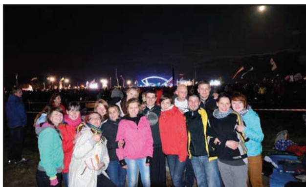
Na polach lednickich

Centralnym punktem spotkania młodych nad Lednicą była Eucharystia pod przewodnictwem prymasa Polski abp. Józefa Kowalczyka. Wraz z księdzem