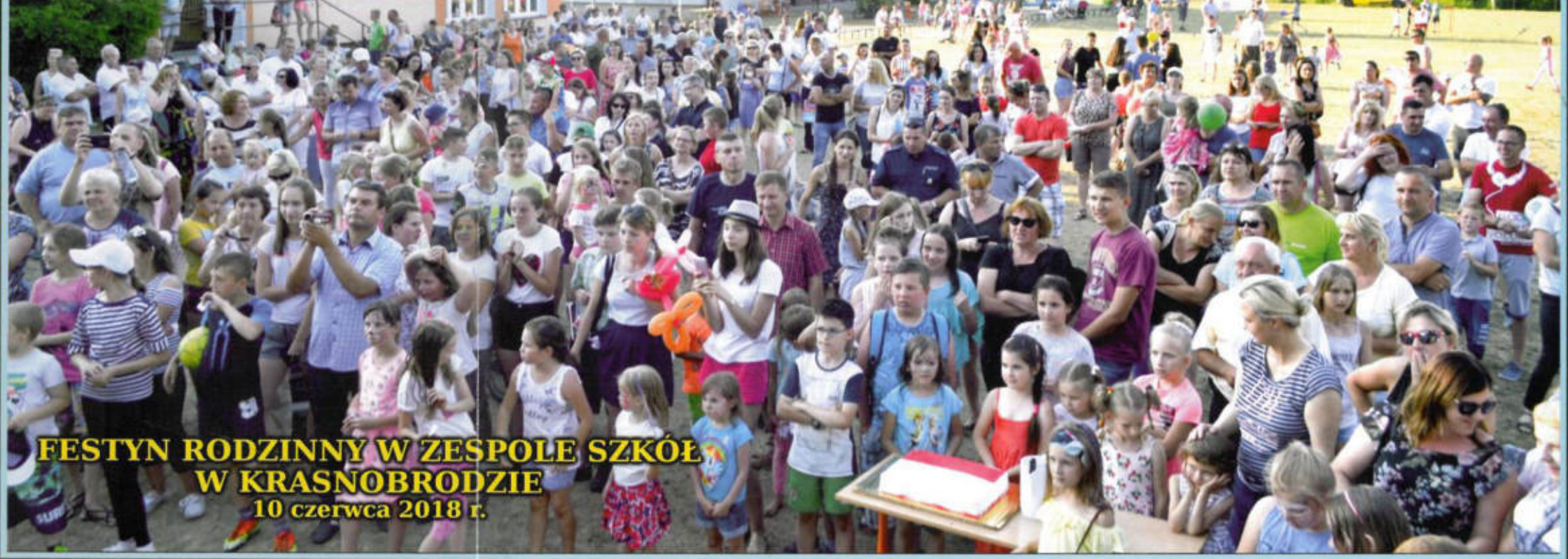
FESTYN RODZINNY W ZESPÓLE SZKÓŁ W KRASNOBRODZIE 10 czerwca 2018 r.