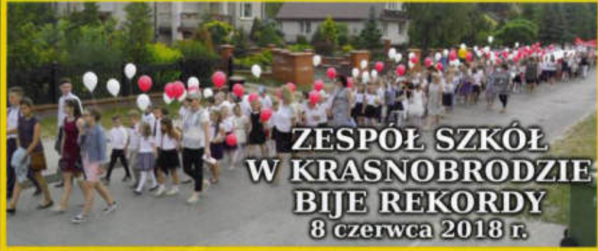
ZESPÓŁ SZKÓŁ W KRASNOBRODZIE BIJE REKORDY 8 czerwca 2018 r.