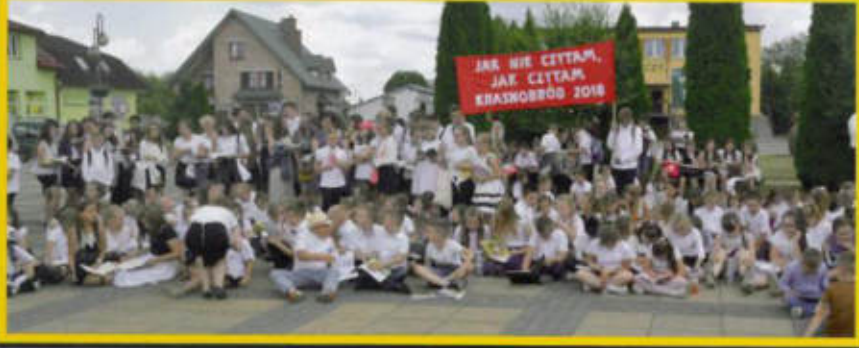
JAK NIE CITTAM, JAR CITTAM KRASNOBROD 2018