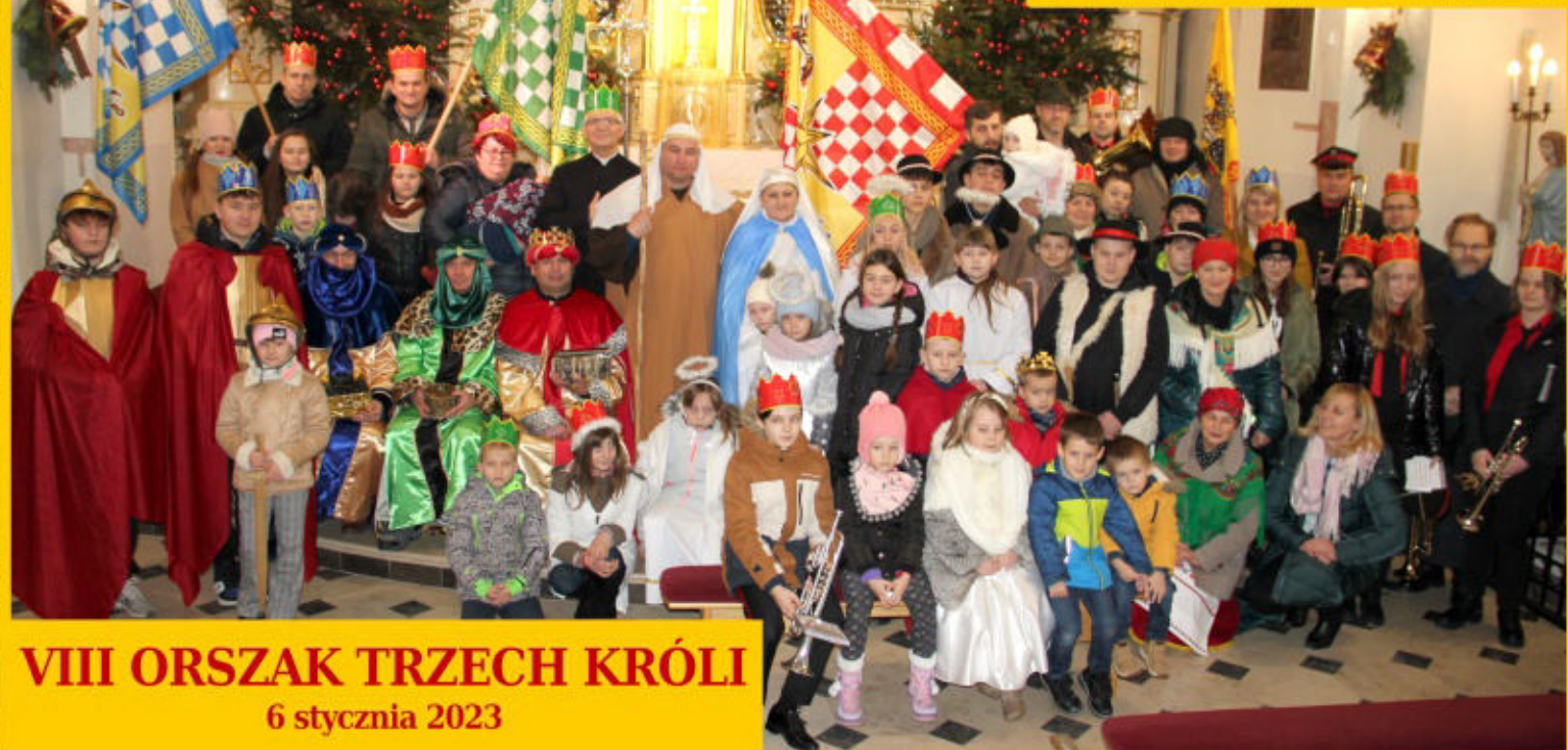
VIII ORSZAK TRZECH KRÓLI 6 stycznia 2023